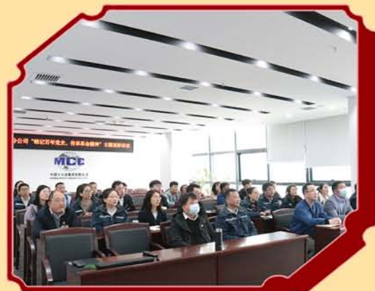
陕西分公司开展“铭记百年党史，传承革命精神”主题观影活动