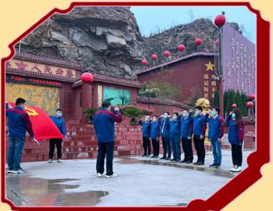
山东梁山地区项目部党支部开展“学习党的历史 缅怀革命先烈 传承革命精神”主题党日