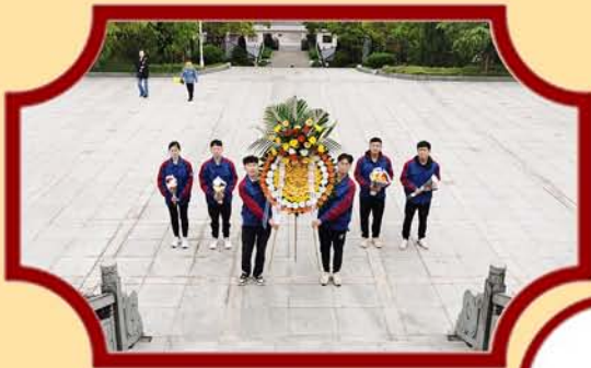
浙江义乌项目向烈士敬献花圈