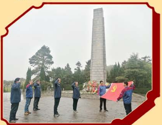
路桥“宁博一体化”项目组织开展清明祭扫活动