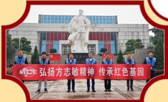
江西弋阳项目党支部开展参观方志敏纪念馆