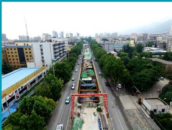
全国规模最大的西安城市地下综合管廊工程

中国十七冶集团把学习贯彻习近平新时代中国特色社会主义思想落实到党建和公司生产经营、改革创新、转型升级的实践中，以高质量党建引领公司高质量发展，实现了党建工作和企业发展相融互促，双向共赢的新格局。