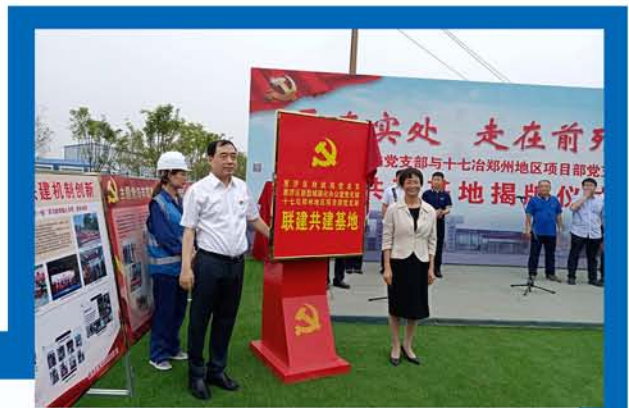
▲ 十七冶与郑州惠济区成立党支部联建共建基地

“合抱之木，生于毫末；九层之台，起于累土。”中国十七冶集团党委全面深刻认识和把握加强党建工作的重要性，坚定不移地把党的领导落实到公司的方方面面，不断提升党建工作科学化水平，不断增强党组织的凝聚力和战斗力，推动党建工作与建设“美好中冶”深度融合，发挥党建联建共建优势，推动公司高质量发展。