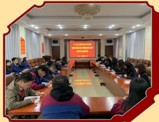
工程科技公司开展“缅怀革命先烈 致敬百年征程”清明节主题活动