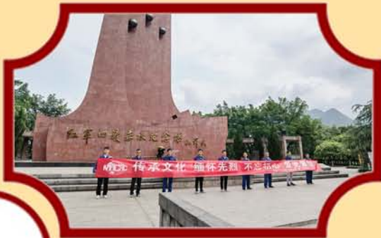
遵义广厦·未来城项目赴红军四渡赤水纪念馆