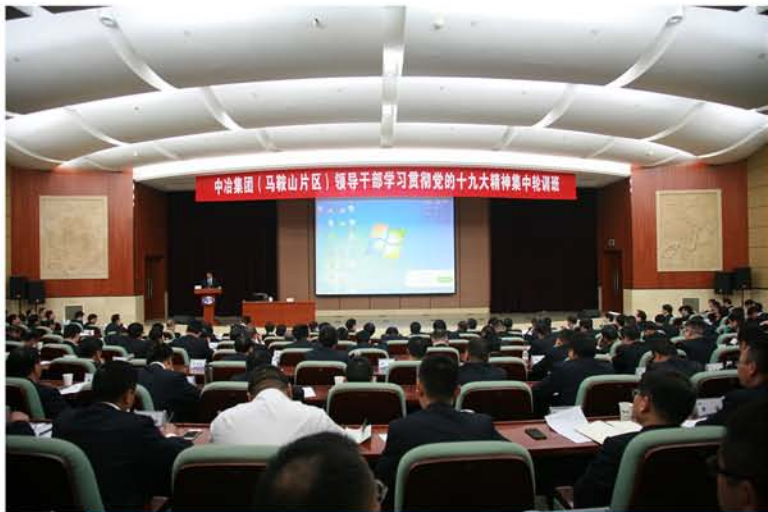
▲ 学习贯彻党的十九大精神集中轮训

2019年培训党务工作者130人次、党支部书记190人次、党员发展对象45人次，2020年培训党务工作者130余人次、党员发展对象126人次，全面深化公司基层党组织“三基建设”，提升基层党建标准化规范化水平。针对在建项目地域跨度大、人员流动快等特点，提出了“围绕项目抓党建，抓好党建促发展”的工作思路，做到项目党支部与项目经理部同步建立、同步配备干部、同步工作，确保所有项目党建工作全覆盖。同时公司大力推动设立联合项目党支部，目前共设立项目联合党支部52个，覆盖到152个项目，随着公司项目越来越多，单一项目配置人员数量日趋减少，公司通过设置联合党支部，实现党员的片区化管理。项目党支部以“实体精品、过程文明、管理高效、团队优秀”为保障目标，使党支部发挥战斗堡垒作用更加突显，与生产经营融合更加有效。