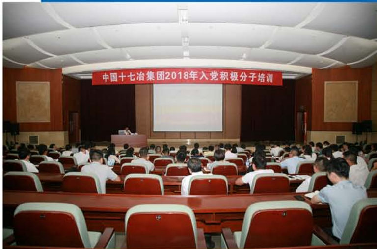
▲ 十七冶举办2018年入党积极分子培训班