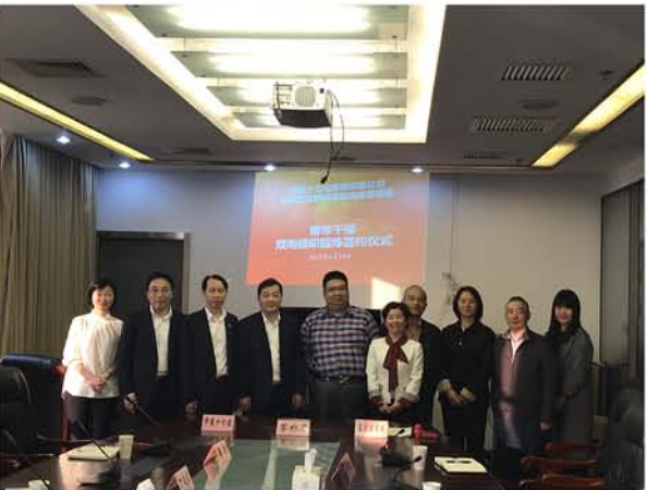
▲ 十七冶与上海嘉定房管局签订青年干部双向挂职协议