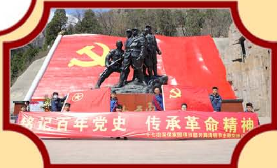
深保家园项目部开展“铭记百年党史 传承革命精神”清明节主题团日活动