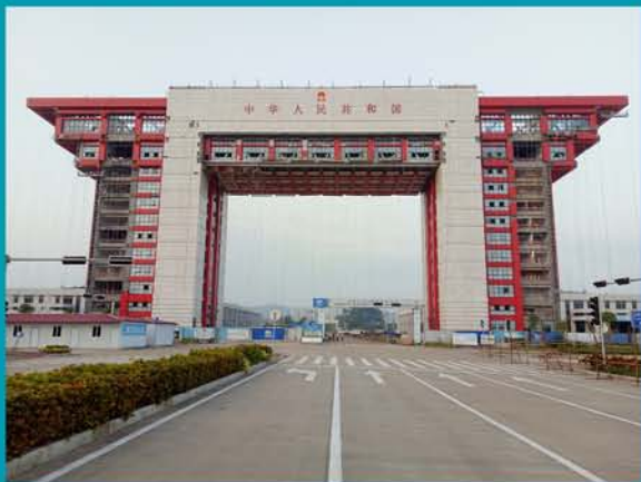
全国陆路沿边最大的广西东兴国门工程