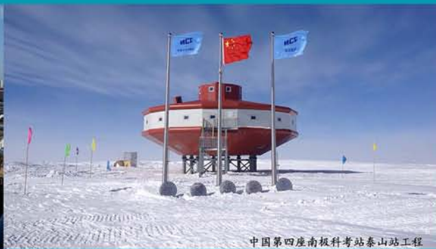
中国第四座南极科考站泰山站工程