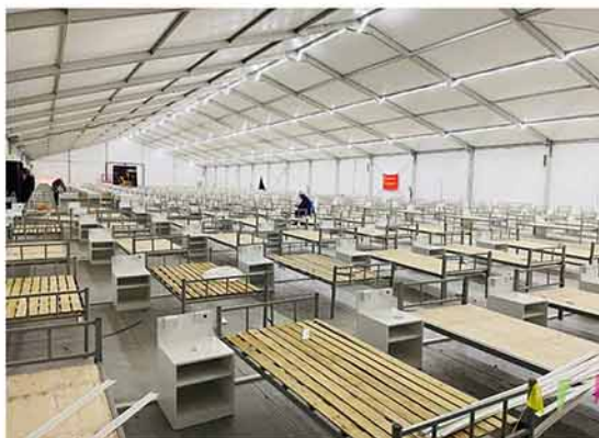
上海分公司党员突击队加速完成床位铺设安装