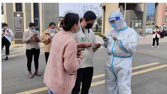
宿马汴河南苑项目团员青年投身防疫一线