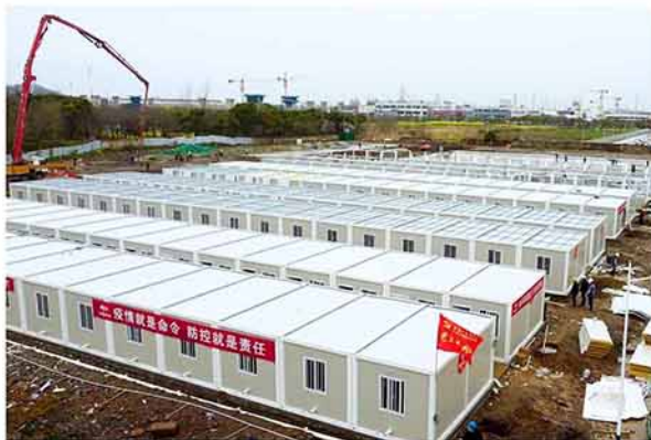
马鞍山经开区南部片区项目的建设者们抓紧建设进度，始终坚持奋战在防疫建设第一线。