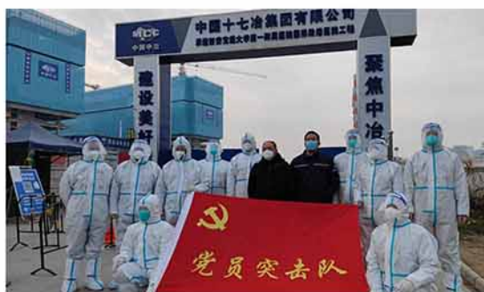
国际陆港医院项目党支部疫情防控志愿服务中“党员先锋队”